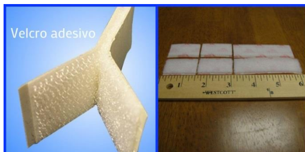
Ilustração 4 - Corte da tira velcro adesiva

Corte quatro pedaços de tira de velcro adesivo (macho e fêmea) com o comprimento de 4 cm e dois pedaços com 8 cm para colar nos dois CDs.