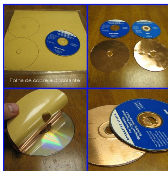
Ilustração 3 - Corte da folha de cobre e colagem aos CDs

Sobreponha cada disco da folha de cobre a cada CD, tirando o revestimento para a folha aderir e colar.