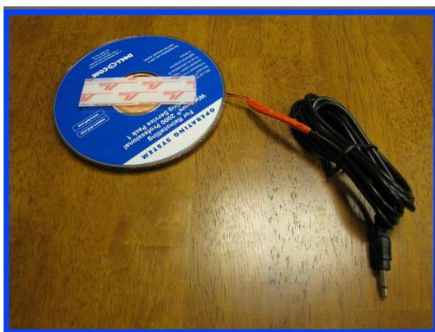
Ilustração 1 - Manípulo com CDs

Os manípulos comercializados no mercado são em geral dispendiosos, propondo-se nestas instruções a construção de um manípulo de baixo custo recorrendo a CD-ROMs e mais algum material.