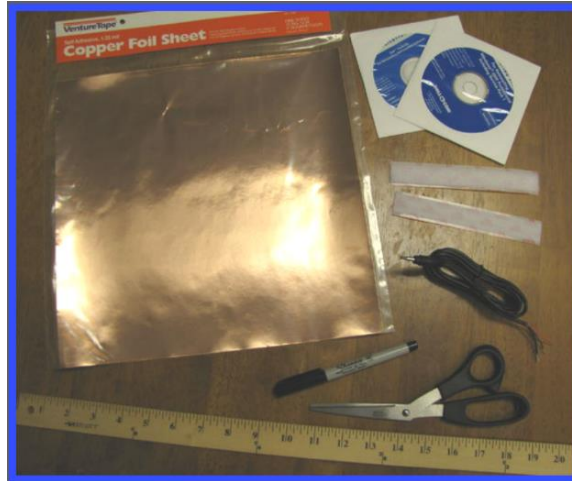
Ilustração 2 – Materiais para a construção do manípulo