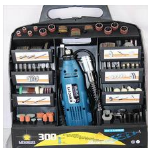
Ilustração 4 - Mini drill kit

Existem várias marcas e kits de berbequim com diversas peças e diversos preços como os exemplos que se ilustram: