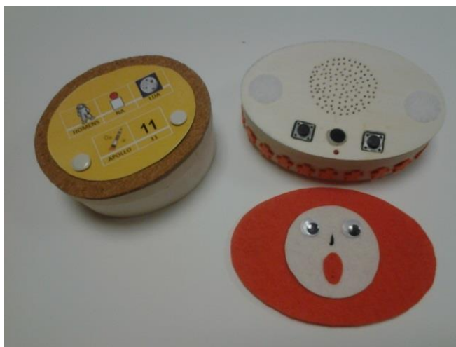
Ilustração 1 – Caixas falantes

Esta ficha visa a construção de um digitalizador de fala, constituído por uma caixinha em balsa e um dispositivo eletrónico que incorpora um microfone, um altifalante, dois botões para gravação e reprodução áudio e um Led que acende em modo de gravação.