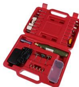
Ilustração 5 - Conjunto mini berbequim