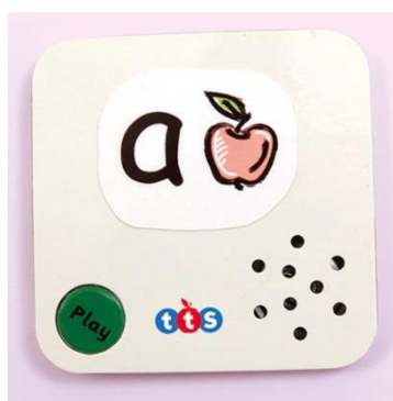
Ilustração 3 - Cartão falante da TTS

A solução da caixa falante poderá ser uma alternativa mais barata aos cartões falantes da empresa TTS .