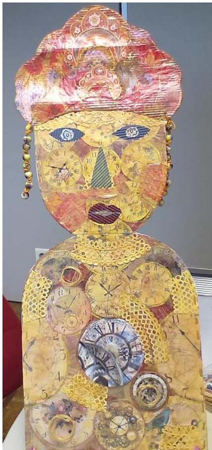
Ilustração 1 – Guardiã do Tempo

Esta ficha visa a construção de um projeto em cartolina/cartão com um circuito elétrico e dois Leds que acenderão no sítio dos olhos da guardiã do tempo.