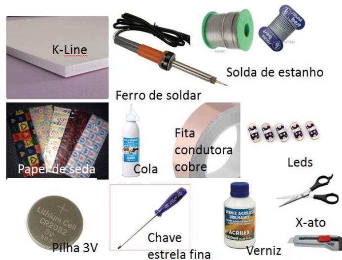
Ilustração 2 - Materiais