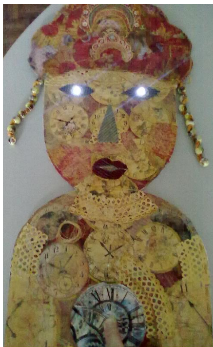
Ilustração 5 - Guardiã com os olhos iluminados