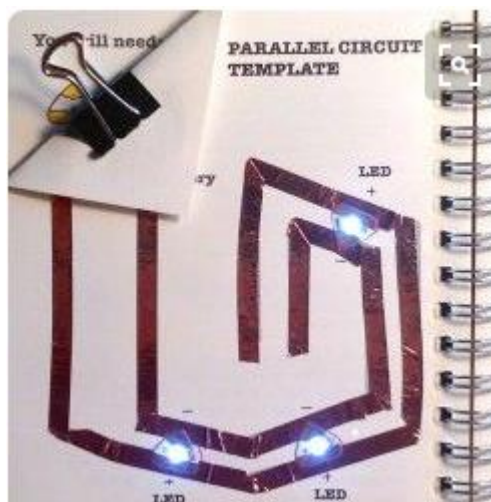
Ilustração 4 - Diagrama da Chibitronics

Ter em conta a dimensão dos Leds pois os polos terão de assentar sobre os dois circuitos paralelos. Neste caso usaram-se uns pequenos Leds planos de Lilypad, que normalmente são cosidos em têxteis e que têm cerca de 13 mm de comprimento.